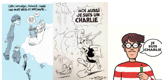
Zep, Uderzo, Handford

Et pour finir voici quelques illustrations d'illustrateurs et auteurs jeunesse en hommage aux illustrateurs et individus qui ont trouvé la mort dans cet horrible attentat